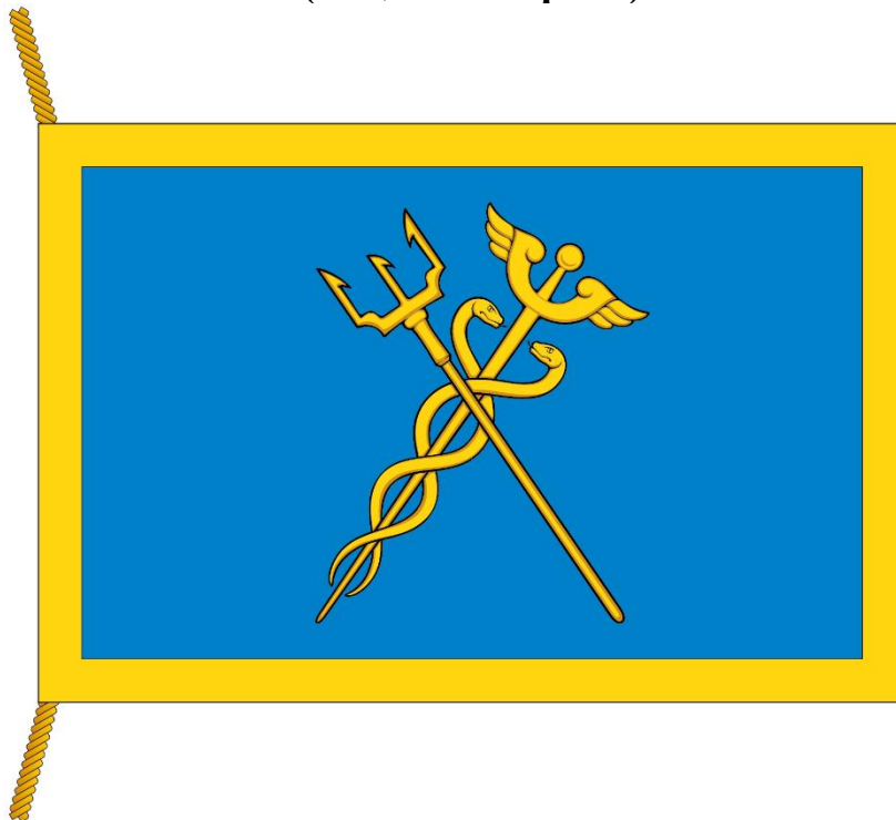
РИСУНОК ФЛАГА МУНИЦИПАЛЬНОГО ОКРУГА СТРОГИНО В ГОРОДЕ МОСКВЕ (лицевая сторона)

Приложение к Положению "О флаге муниципального округа Строгино в городе Москве"