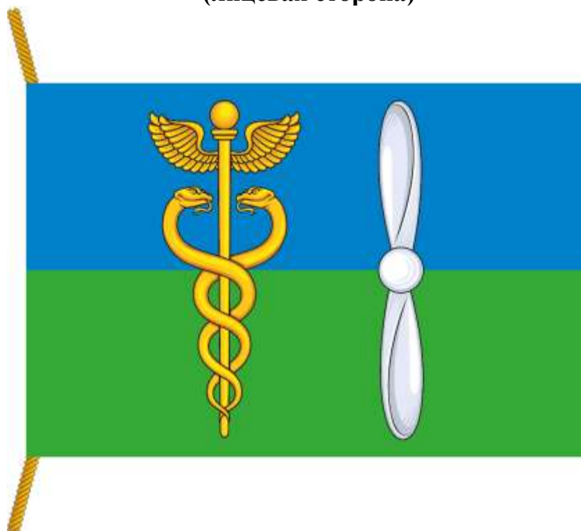
РИСУНОК ФЛАГА МУНИЦИПАЛЬНОГО ОКРУГА ЮЖНОЕ ТУШИНО В ГОРОДЕ МОСКВЕ (лицевая сторона)

Приложение к Положению «О флаге муниципального округа Южное Тушино в городе Москве»