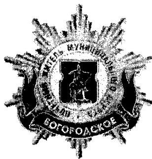
Рисунок нагрудного знака к званию «Почетный житель внутригородского муниципального образования – муниципального округа Богородское в городе Москве»

Приложение 3 к решению Совета депутатов внутригородского муниципального образования – муниципального округа Богородское в городе Москве от 18 февраля 2025 года № 04/01