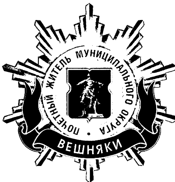
Рисунок нагрудного знака к званию «Почетный житель внутригородского муниципального образования – муниципального округа Вешняки в городе Москве»

Приложение 3 к решению Совета депутатов внутригородского муниципального образования – муниципального округа Вешняки в городе Москве от 18.02.2025 № 1/37