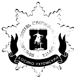
Рисунок нагрудного знака к званию «Почетный житель внутригородского муниципального образования – муниципального округа Косино-Ухтомский в городе Москве»

Приложение 3 к решению Совета депутатов внутригородского муниципального образования – муниципального округа Косино-Ухтомский в городе Москве от 18 февраля 2025 года № 1/3-25