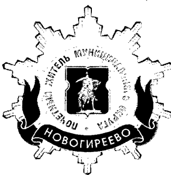
Рисунок нагрудного знака к званию «Почетный житель внутригородского муниципального образования – муниципального округа Новогиреево в городе Москве»

Приложение 3 к решению Совета депутатов внутригородского муниципального образования – муниципального округа Новогиреево в городе Москве от 18.02.2025 года № 04-02/25