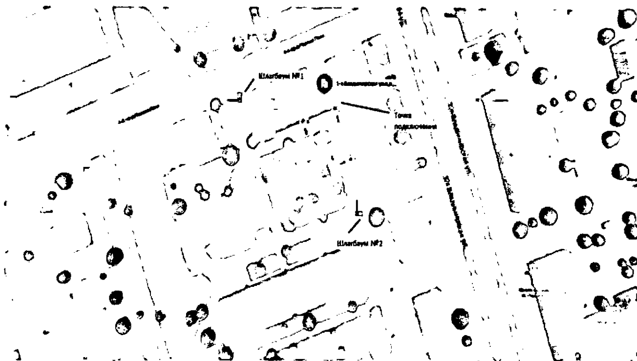
Рис. 1. Схема размещения ограждающих устройств