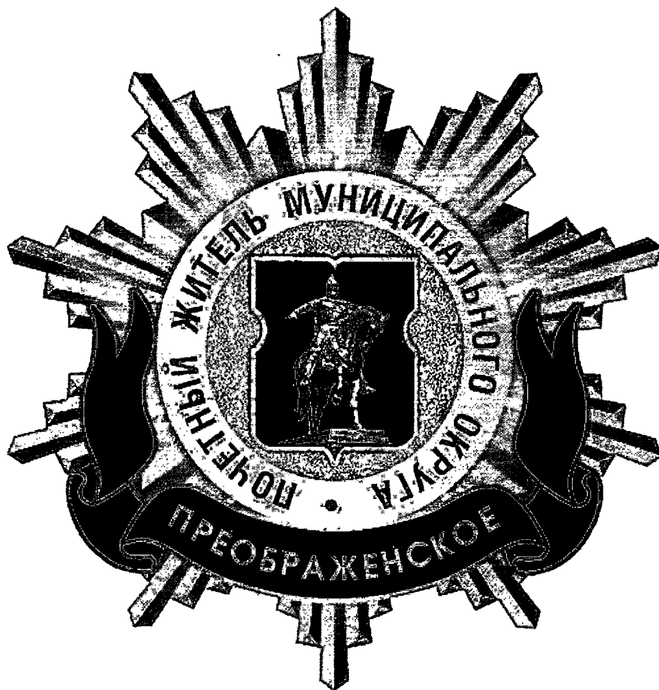
Рисунок нагрудного знака к званию «Почетный житель внутригородского муниципального образования – муниципального округа Преображенское в городе Москве»

Приложение 3 к решению Совета депутатов внутригородского муниципального образования – муниципального округа Преображенское в городе Москве от 18.02.2025 № 04/01