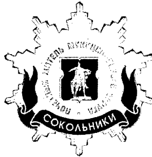
Рисунок нагрудного знака к званию «Почетный житель внутригородского муниципального образования – муниципального округа Сокольники в городе Москве»

Приложение 3 к решению Совета депутатов внутригородского муниципального образования – муниципального округа Сокольники в городе Москве от 18 февраля 2025 года № 4/1