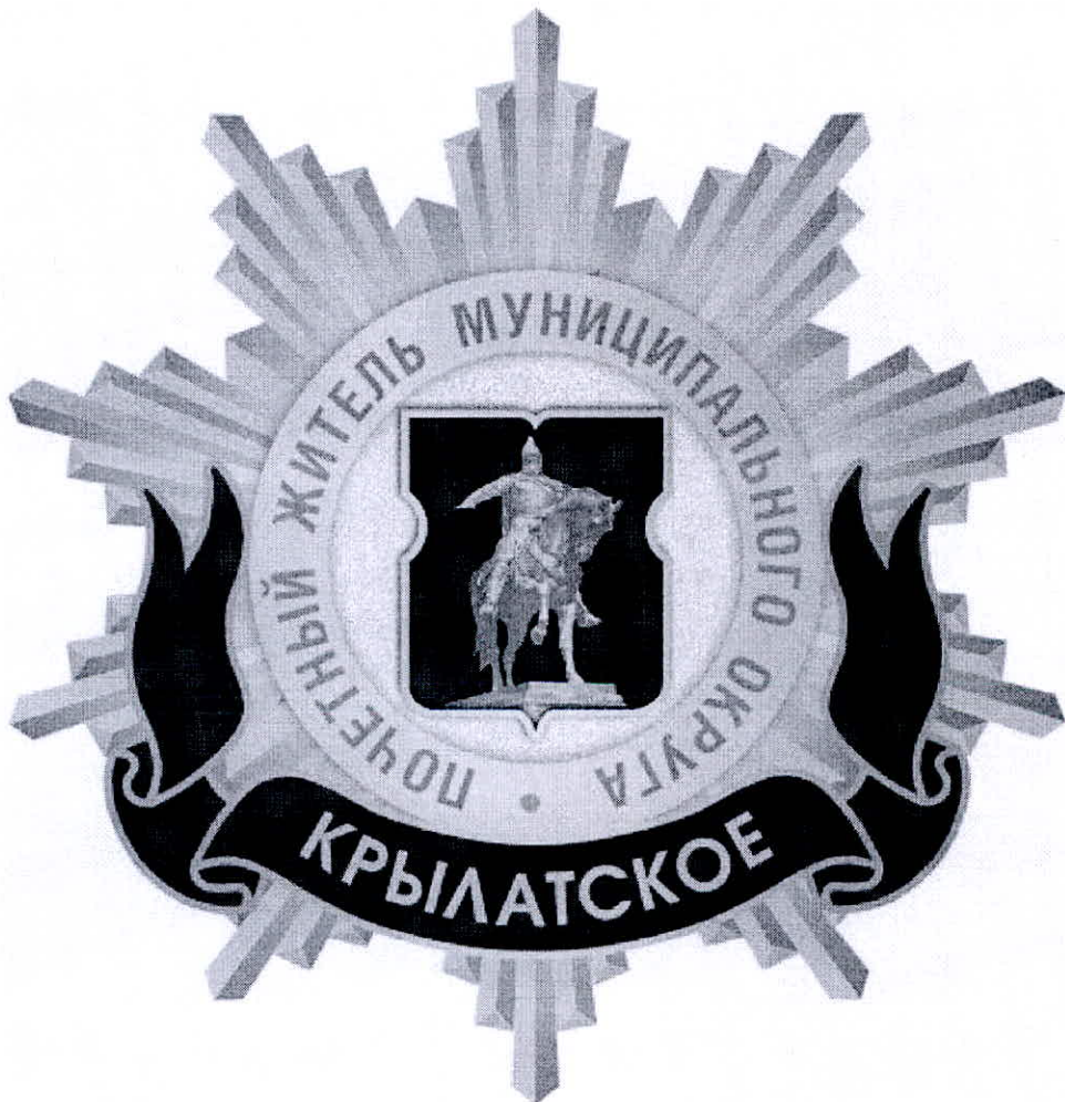
Рисунок нагрудного знака к званию «Почетный житель внутригородского муниципального образования – муниципального округа Крылатское в городе Москве»

Приложение 3 к решению Совета депутатов внутригородского муниципального образования – муниципального округа Крылатское в городе Москве от 20.02.2025г. № 3/5