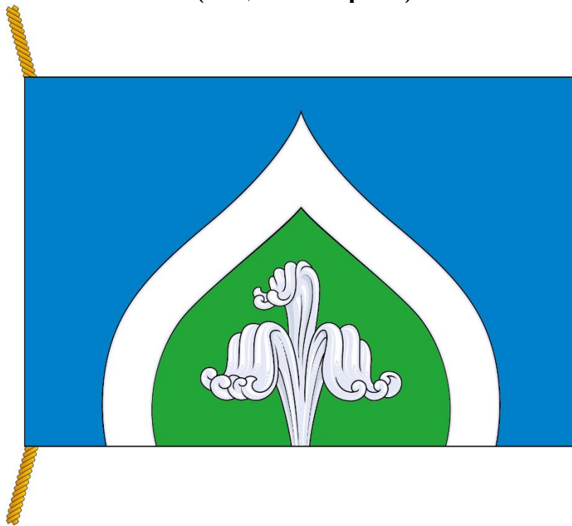
РИСУНОК ФЛАГА МУНИЦИПАЛЬНОГО ОКРУГА КРЫЛАТСКОЕ В ГОРОДЕ МОСКВЕ (лицевая сторона)

Приложение к Положению "О флаге муниципального округа Крылатское в городе Москве"