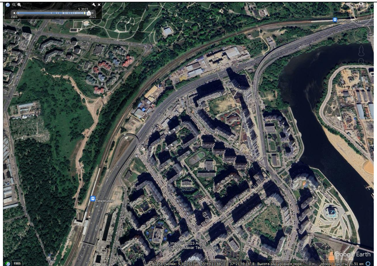
Рис. 7. Участки, включённые в состав П-ИП «Москворецкий», расположены в основном вдоль Рижской железной дороги – в пределах её полосы отвода и охранной зоны – и представлены защитной лесополосой и сформировавшейся после 2003 года древесной и травянистой растительностью.

5.3.1. Указанные выше показатели баланса должны быть установлены применительно: