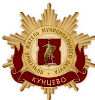
Рисунок нагрудного знака к званию «Почетный житель внутригородского муниципального образования – муниципального округа Кунцево в городе Москве»

Приложение 3 к решению Совета депутатов внутригородского муниципального образования – муниципального округа Кунцево в городе Москве от 19 февраля 2025 года №38/1.СД МОК/25