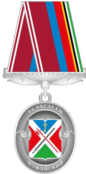
Рисунок знака отличия муниципального округа Можайский в городе Москве "За заслуги"

Приложение 7 к решению Совета депутатов муниципального округа Можайский от 17 января 2024 года № 1-13 СД/24