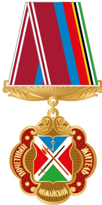
Рисунок ленты знака к почетному званию муниципального округа Можайский в городе Москве "Почетный житель муниципального округа Можайский в городе Москве" в виде розетки

Рисунок знака к почетному званию муниципального округа Можайский в городе Москве "Почетный житель муниципального округа Можайский в городе Москве" (на трапециевидной колодке)