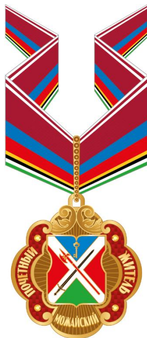
Рисунок знака к почетному званию муниципального округа Можайский в городе Москве "Почетный житель муниципального округа Можайский в городе Москве"(на шейной ленте)

Приложение 4 к решению Совета депутатов муниципального округа Можайский от 17 января 2024 года № 1-13СД/24