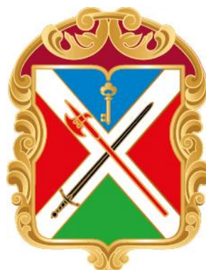
Рисунок нагрудного знака к Почетной грамоте муниципального округа Можайский в городе Москве

Приложение 10 к решению Совета депутатов муниципального округа Можайский от 17 января 2024 года № 1-13 СД/24