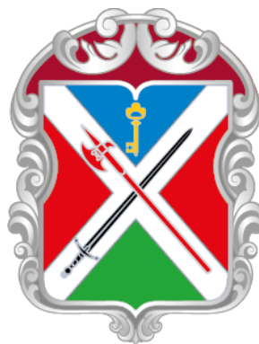
Рисунок нагрудного знака к Благодарности муниципального округа Можайский в городе Москве

Приложение 13 к решению Совета депутатов муниципального округа Можайский от 17 января 2024 года № 1-13 СД/24