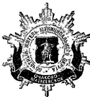
Рисунок нагрудного знака к званию «Почетный житель внутригородского муниципального образования – муниципального округа Очаково- Матвеевское в городе Москве»

Приложение 3 к решению Совета депутатов внутригородского муниципального образования – муниципального округа Очаково-Матвеевское в городе Москве от 19 февраля 2025 года № 14-СД