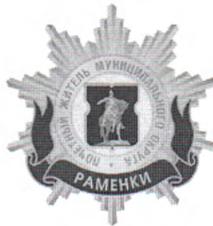
Рисунок нагрудного знака к званию «Почетный житель внутригородского муниципального образования – муниципального округа Раменки в городе Москве»

Приложение 3 к решению Совета депутатов внутригородского муниципального образования - муниципального округа Раменки в городе Москве от 18 февраля 2025 года №01-02/36