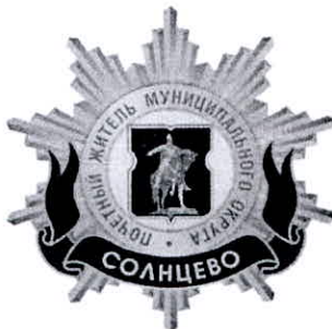
Рисунок нагрудного знака к званию «Почетный житель внутригородского муниципального образования – муниципального округа Солнцево в городе Москве»

Приложение 3 к решению Совета депутатов внутригородского муниципального образования – муниципального округа Солнцево в городе Москве от 20 февраля 2025 года № 32/4