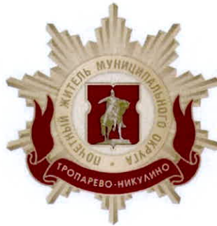
Рисунок нагрудного знака к званию «Почетный житель внутригородского муниципального образования – муниципального округа Тропарево-Никулино в городе Москве»

Приложение 3 к решению Совета депутатов внутригородского муниципального образования – муниципального округа Тропарево-Никулино в городе Москве от 20.02.2025 года № 3/1