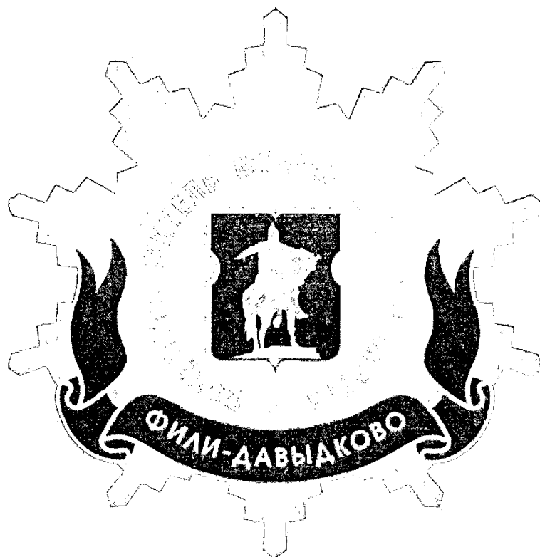
Рисунок нагрудного знака к званию «Почетный житель внутригородского муниципального образования – муниципального округа Фили-Давыдково в городе Москве»

Приложение 3 к решению Совета депутатов внутригородского муниципального образования – муниципального округа Фили-Давыдково в городе Москве от 18 февраля 2025 года № 3/1-СД