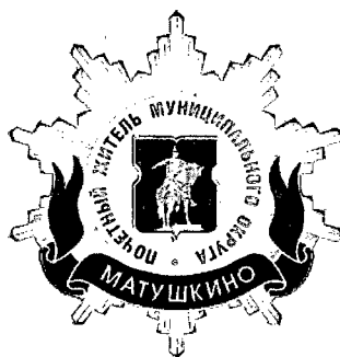
Рисунок нагрудного знака к званию «Почетный житель внутригородского муниципального образования – муниципального округа Матушкино в городе Москве»

Приложение 3 к решению Совета депутатов внутригородского муниципального образования – муниципального округа Матушкино в городе Москве от 18 февраля 2025 года № 2/7