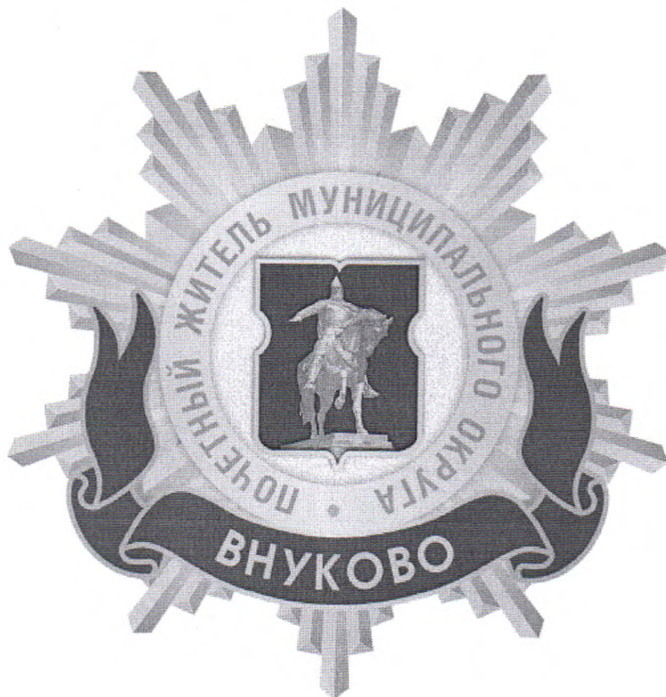
Рисунок нагрудного знака к званию «Почетный житель внутригородского муниципального образования – муниципального округа Внуково в городе Москве»

Приложение 3 к решению Совета депутатов внутригородского муниципального образования – муниципального округа Внуково в городе Москве от 18 февраля 2025 года № 2/12