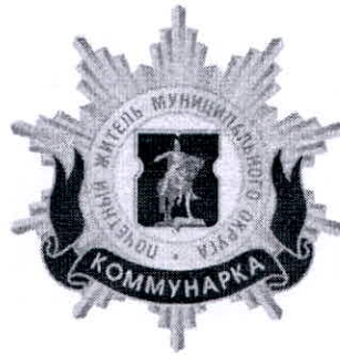
Рисунок нагрудного знака к званию «Почетный житель внутригородского муниципального образования – муниципального округа Коммунарка в городе Москве»

Приложение 3 к решению Совета депутатов внутригородского муниципального образования – муниципального округа Коммунарка в городе Москве от 20 февраля 2025 года № 13/1