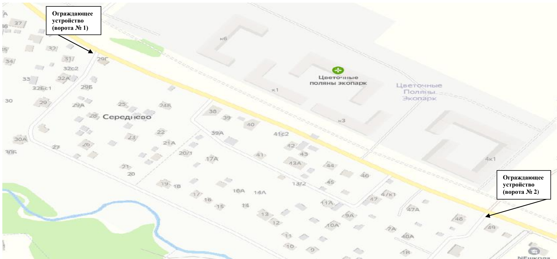
Схема размещения ограждающих устройств

Приложение к решению Совета депутатов поселения Филимонковское от 20.07.2023 № 65/5