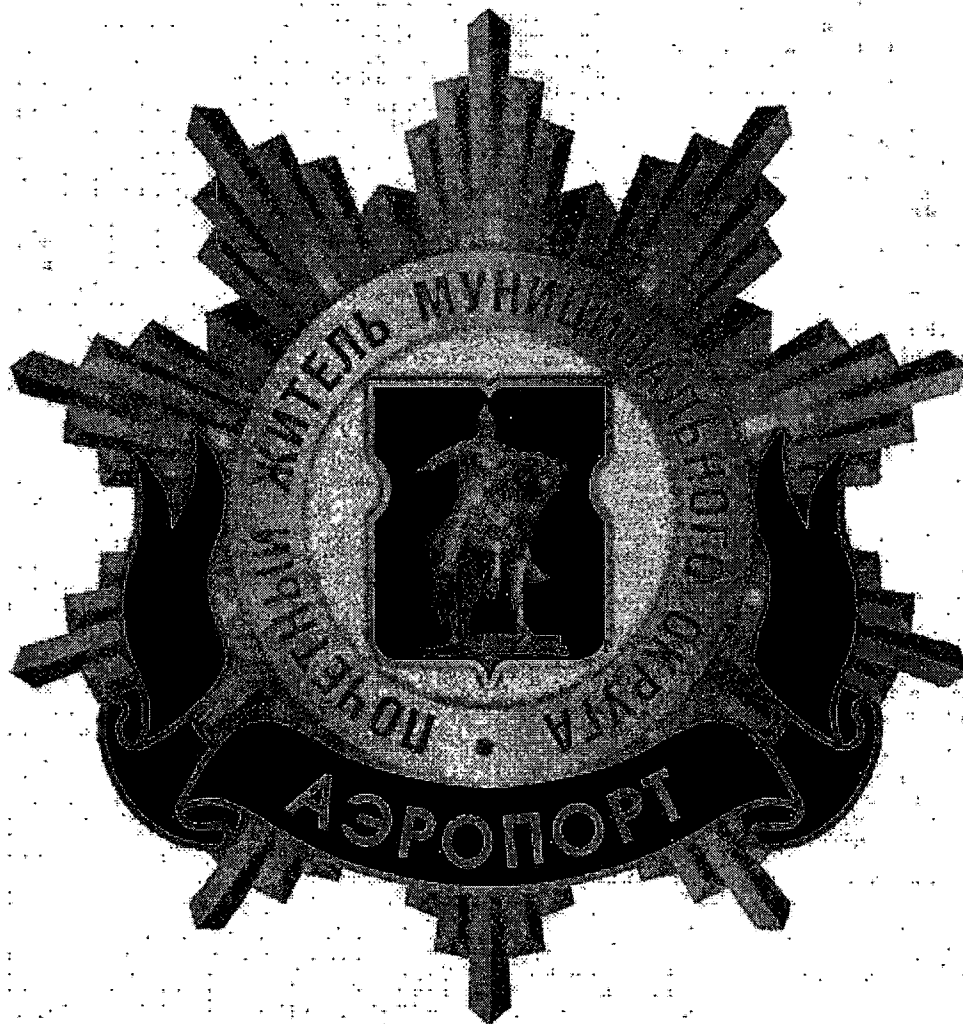
Рисунок нагрудного знака к званию «Почетный житель внутригородского муниципального образования – муниципального округа Аэропорт в городе Москве»

Приложение 3 к решению Совета депутатов внутригородского муниципального образования – муниципального округа Аэропорт в городе Москве от 19.02.2025 года № 33/06