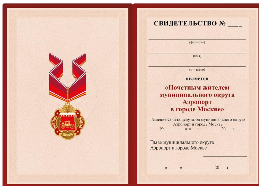
Внутренняя сторона Размер свидетельства 210×150 мм