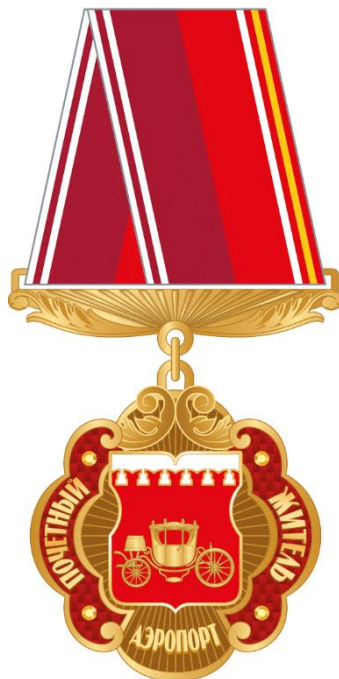
Рисунок ленты знака к почетному званию муниципального округа Аэропорт в городе Москве "Почетный житель муниципального округа Аэропорт в городе Москве" в виде розетки

Рисунок знака к почетному званию муниципального округа Аэропорт в городе Москве "Почетный житель муниципального округа Аэропорт в городе Москве" (на трапециевидной колодке)