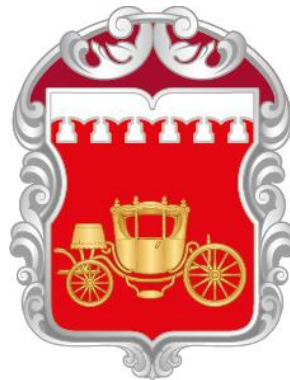
Рисунок нагрудного знака к Благодарности муниципального округа Аэропорт в городе Москве

Приложение 13 к решению Совета депутатов муниципального округа Аэропорт в городе Москве от 19 июня 2024 года № 24/03