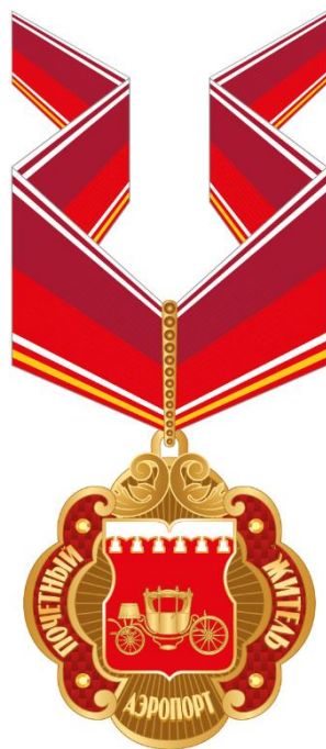
Рисунок знака к почетному званию муниципального округа Аэропорт в городе Москве "Почетный житель муниципального округа Аэропорт в городе Москве"(на шейной ленте)

Приложение 4 к решению Совета депутатов муниципального округа Аэропорт в городе Москве от 19 июня 2024 года № 24/03