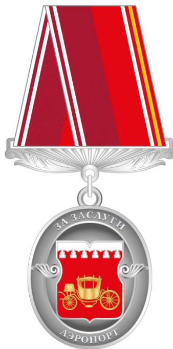
Рисунок знака отличия муниципального округа Аэропорт в городе Москве "За заслуги"

Приложение 7 к решению Совета депутатов муниципального округа Аэропорт в городе Москве от 19 июня 2024 года № 24/03