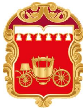
Рисунок нагрудного знака к Почетной грамоте муниципального округа Аэропорт в городе Москве

Приложение 10 к решению Совета депутатов муниципального округа Аэропорт в городе Москве от 19 июня 2024 года № 24/03