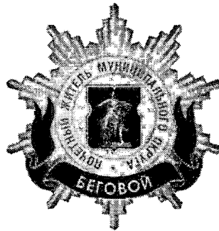
Рисунок нагрудного знака к званию «Почетный житель внутригородского муниципального образования – муниципального округа Беговой в городе Москве»

Приложение 3 к решению Совета депутатов внутригородского муниципального образования – муниципального округа Беговой в городе Москве от 18 февраля 2025 года № 35-6