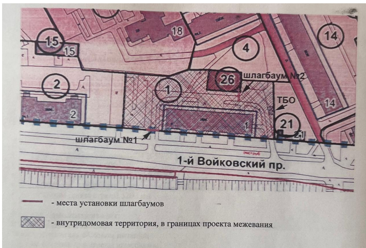
Рис. 1 Схема размещения