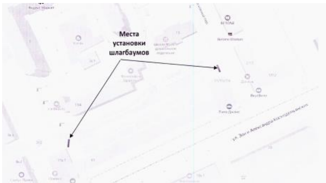
Рис. 1 Схема размещения