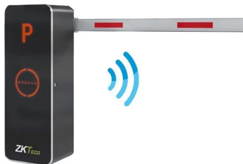
Внешний вид шлагбаума

1. Тип шлагбаума - автоматический шлагбаум ZKTeco BG1060L Wi-Fi с телескопической стрелой 6 метров, левосторонний, с настройкой параметров конфигурации по сети Wi-Fi.