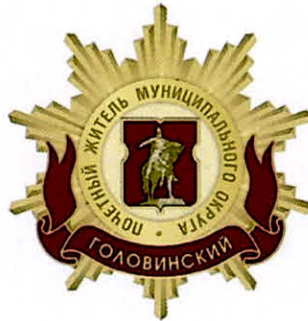
Рисунок нагрудного знака к званию «Почетный житель внутригородского муниципального образования – муниципального округа Головинский в городе Москве»

Приложение 3 к решению Совета депутатов внутригородского муниципального образования – муниципального округа Головинский в городе Москве от 18 февраля 2025 года № 13