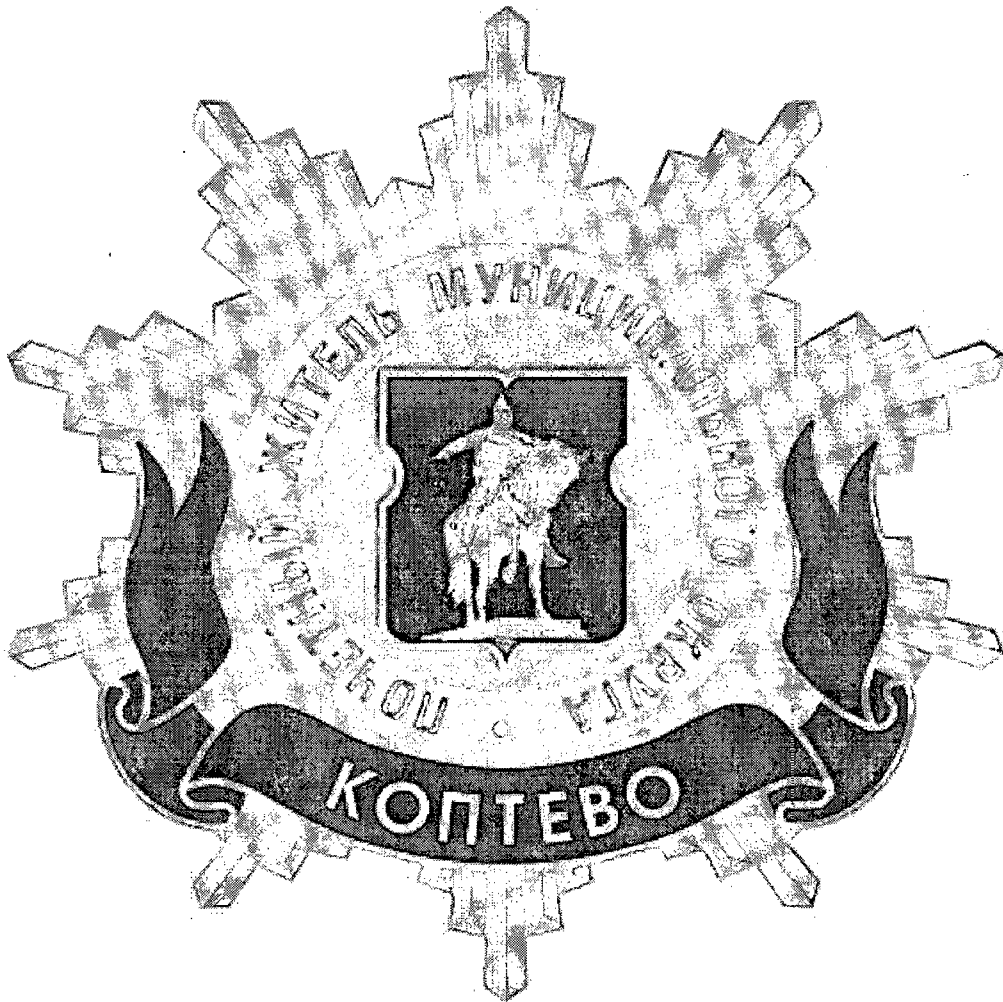
Рисунок нагрудного знака к званию «Почетный житель внутригородского муниципального образования – муниципального округа Коптево в городе Москве»

Приложение 3 к решению Совета депутатов внутригородского муниципального образования – муниципального округа Коптево в городе Москве от 19.02.2025 г. № 3/1