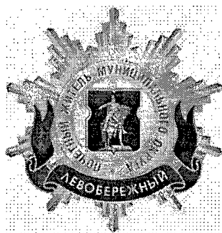
Рисунок нагрудного знака к званию «Почетный житель внутригородского муниципального образования – муниципального округа Левобережный в городе Москве»

Приложение 3 к решению Совета депутатов внутригородского муниципального образования – муниципального округа Левобережный в городе Москве от 18.02.2025 № 2-1