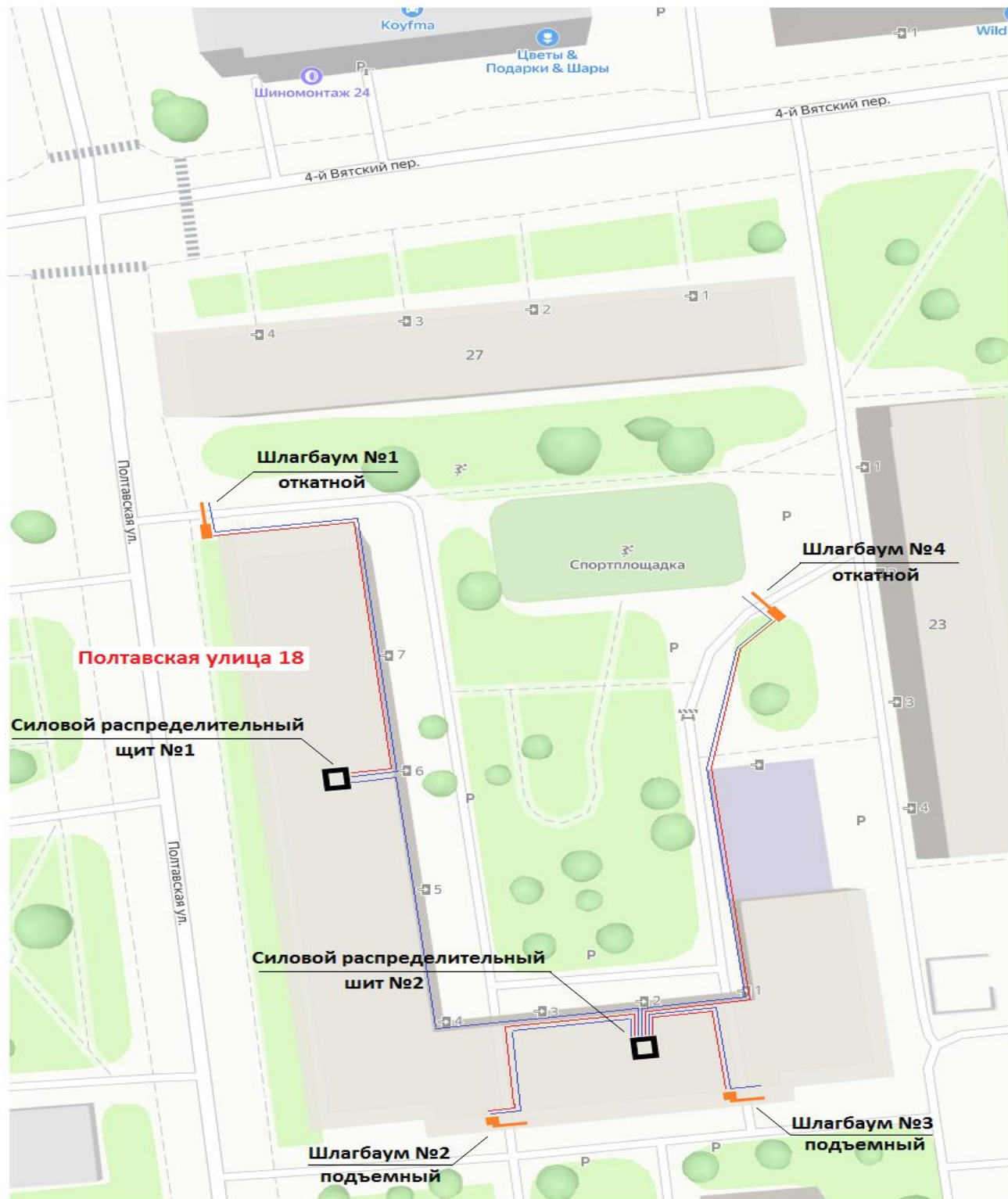
Схема установки ограждающих устройств (4 шлагбаума) на придомовой территории в муниципальном округе Савеловский в городе Москве по адресу: г. Москва, Полтавская улица, дом 18

— Провод 220В - 3х1,5мм — Провод Ethernet - UTP 5e