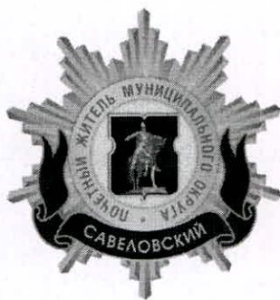
Рисунок нагрудного знака к званию «Почетный житель внутригородского муниципального образования – муниципального округа Савеловский в городе Москве»

Приложение 3 к решению Совета депутатов внутригородского муниципального образования – муниципального округа Савеловский в городе Москве от 19 февраля 2025 года № 2/1