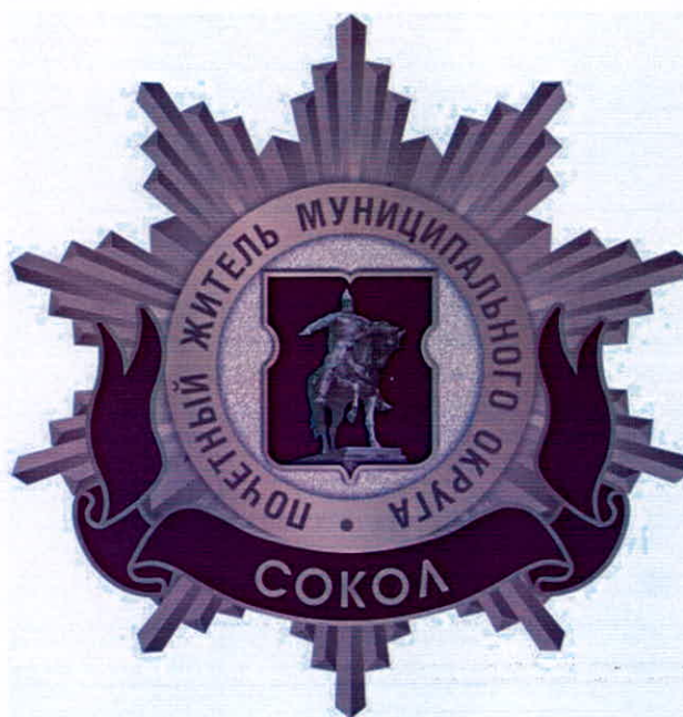
Рисунок нагрудного знака к званию «Почетный житель внутригородского муниципального образования – муниципального округа Сокол в городе Москве»

Приложение 3 к решению Совета депутатов муниципального округа Сокол в городе Москве от 19 февраля 2025 года № 48/4-С