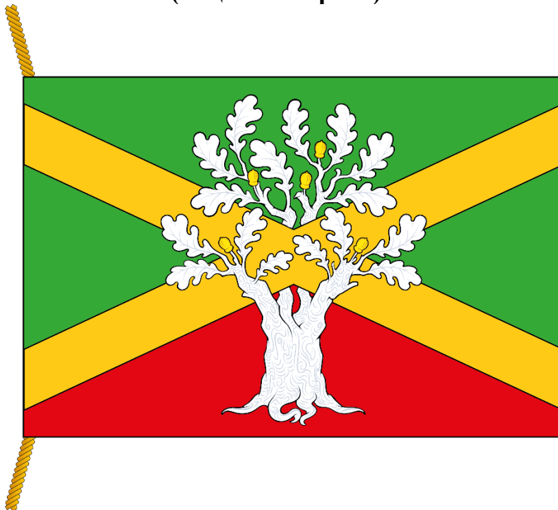
РИСУНОК ФЛАГА МУНИЦИПАЛЬНОГО ОКРУГА ХОВРИНО В ГОРОДЕ МОСКВЕ (лицевая сторона)

Приложение к Положению «О флаге муниципального округа Ховрино в городе Москве»