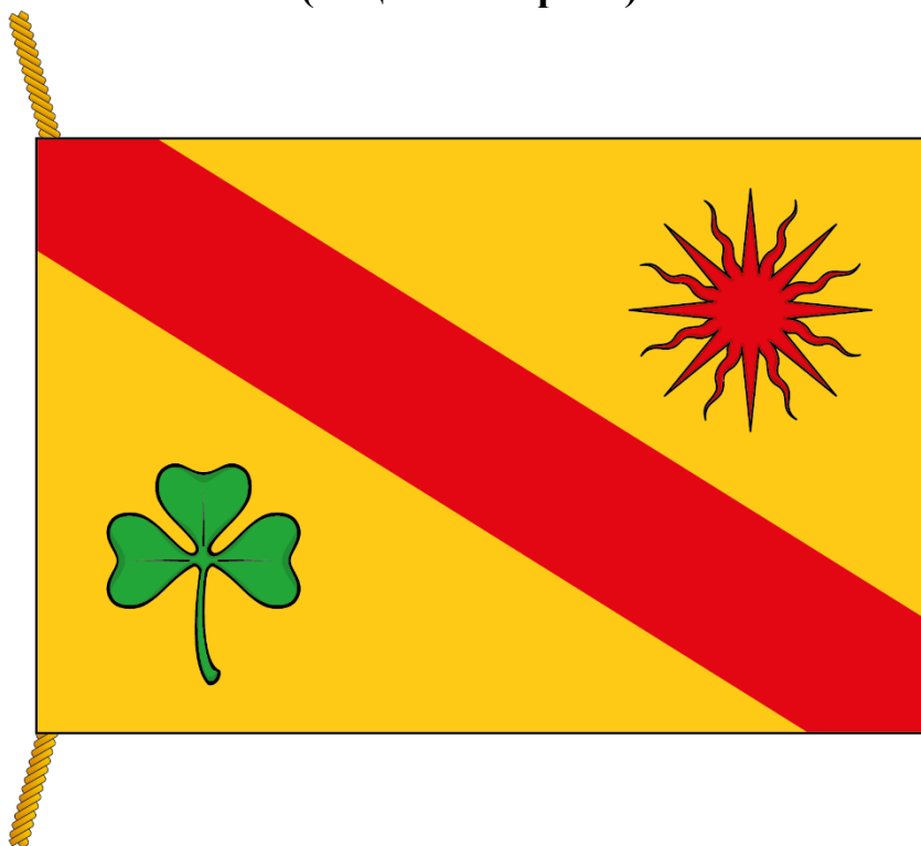
Рисунок флага муниципального округа Алтуфьевский (лицевая сторона)

к Положению о флаге муниципального округа Алтуфьевский в городе Москве