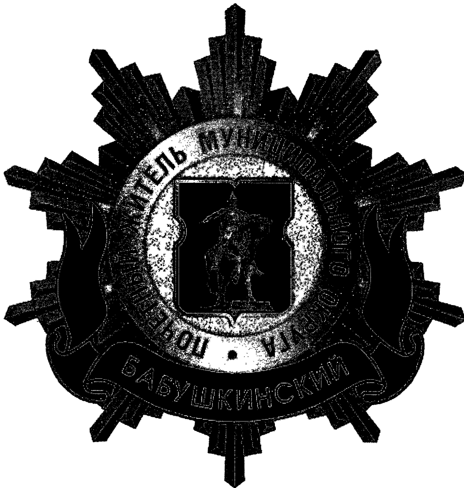
Рисунок нагрудного знака к званию «Почетный житель внутригородского муниципального образования – муниципального округа Бабушкинский в городе Москве»

Приложение 3 к решению Совета депутатов внутригородского муниципального образования – муниципального округа Бабушкинский в городе Москве от 18 февраля 2025 года № 2/11