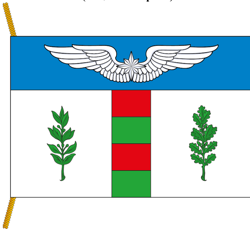
РИСУНОК ФЛАГА МУНИЦИПАЛЬНОГО ОКРУГА БАБУШКИНСКИЙ В ГОРОДЕ МОСКВЕ (лицевая сторона)

Приложение к Положению "О флаге муниципального округа Бабушкинский в городе Москве"