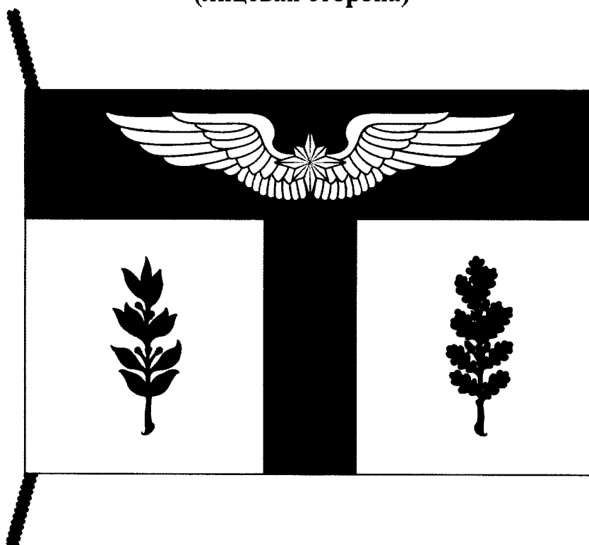
РИСУНОК ФЛАГА МУНИЦИПАЛЬНОГО ОКРУГА БАБУШКИНСКИЙ В ГОРОДЕ МОСКВЕ (лицевая сторона)

Приложение к Положению "О флаге внутригородского муниципального образования- муниципального округа Бабушкинский в городе Москве"