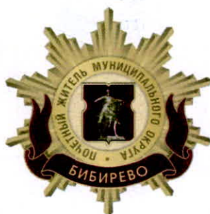
Рисунок нагрудного знака к званию «Почетный житель внутригородского муниципального образования – муниципального округа Бибирево в городе Москве»

к решению Совета депутатов внутригородского муниципального образования – муниципального округа Бибирево в городе Москве от 20 февраля 2025 года № 4/6