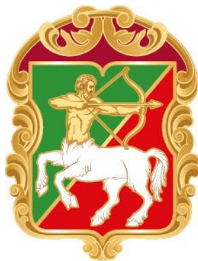
Рисунок нагрудного знака к Почетной грамоте муниципального округа Бутырский в городе Москве

Приложение 10 к решению Совета депутатов муниципального округа Бутырский от 22.06.2023 № 01-04/11-7