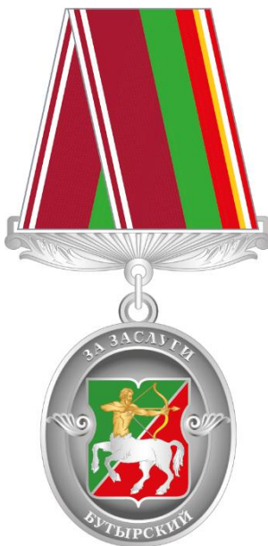
Рисунок знака отличия муниципального округа Бутырский в городе Москве "За заслуги"

Приложение 7 к решению Совета депутатов муниципального округа Бутырский от 22.06.2023 № 01-04/11-7