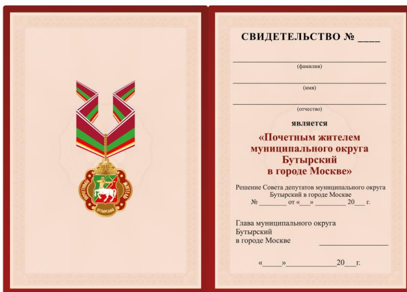
Внутренняя сторона Размер свидетельства 210×150 мм