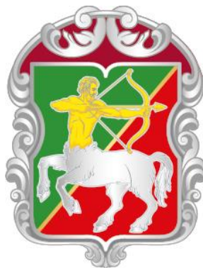
Рисунок нагрудного знака к Благодарности муниципального округа Бутырский в городе Москве

Приложение 13 к решению Совета депутатов муниципального округа Бутырский от 22.06.2023 № 01-04/11-7