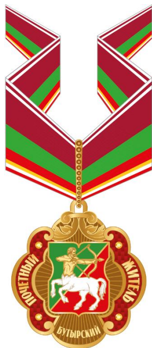
Рисунок знака к почетному званию муниципального округа Бутырский в городе Москве "Почетный житель муниципального округа Бутырский в городе Москве"(на шейной ленте)

Приложение 4 к решению Совета депутатов муниципального округа Бутырский от 22.06.2023 № 01-04/11-7