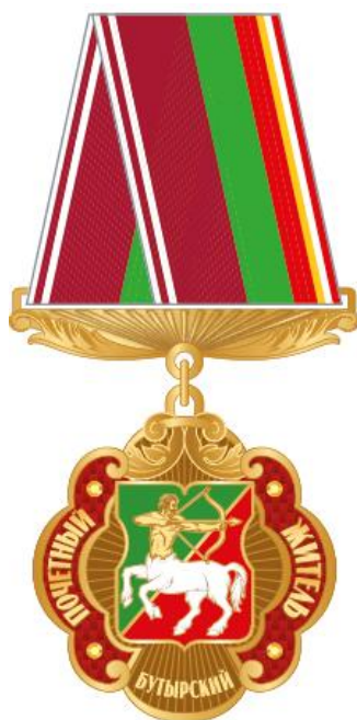
Рисунок ленты знака к почетному званию муниципального округа Бутырский в городе Москве "Почетный житель муниципального округа Бутырский в городе Москве" в виде розетки

Рисунок знака к почетному званию муниципального округа Бутырский в городе Москве "Почетный житель муниципального округа Бутырский в городе Москве" (на трапециевидной колодке)