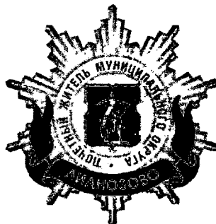
Рисунок нагрудного знака к званию «Почетный житель внутригородского муниципального образования – муниципального округа Лианозово в городе Москве»

Приложение 3 к решению Совета депутатов внутригородского муниципального образования – муниципального округа Лианозово в городе Москве от 18.02.2025 № 15-РСД