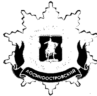
Рисунок нагрудного знака к званию «Почетный житель внутригородского муниципального образования – муниципального округа Лосиноостровский в городе Москве»

Приложение 3 к решению Совета депутатов внутригородского муниципального образования – муниципального округа Лосиноостровский в городе Москве от 18 февраля 2025 г. № 2/4-СД