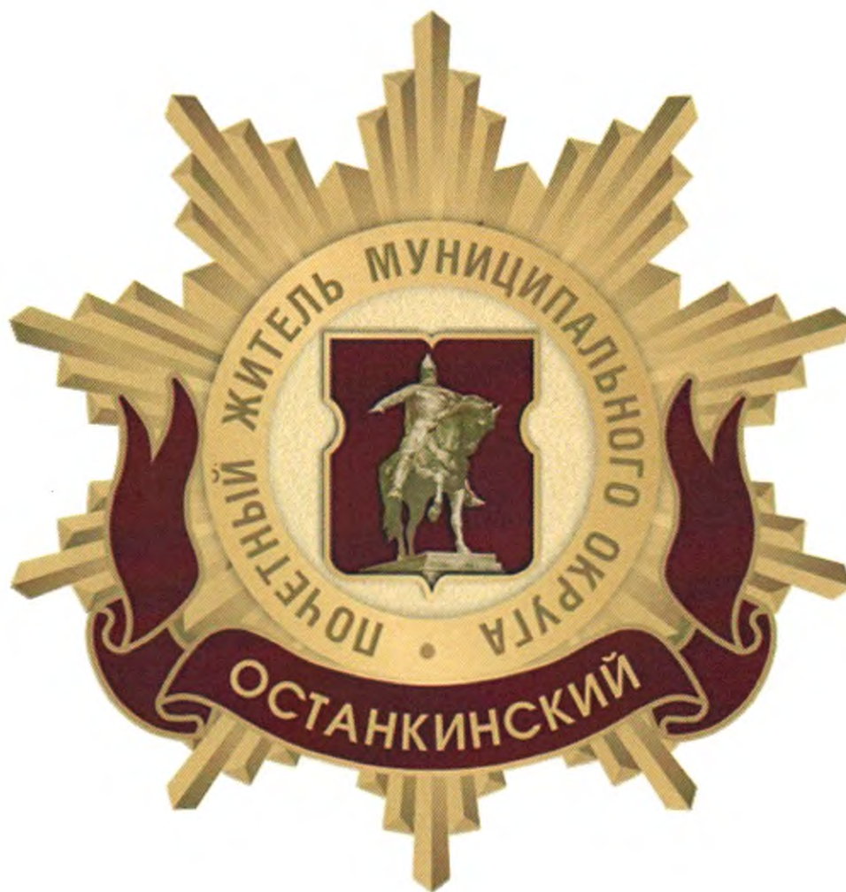
Рисунок нагрудного знака к званию «Почетный житель внутригородского муниципального образования – муниципального округа Останкинский в городе Москве»

Приложение 3 к решению Совета депутатов внутригородского муниципального образования – муниципального округа Останкинский в городе Москве от 19.02.2025 № 3/6