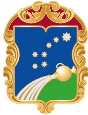
Рисунок нагрудного знака к Почетной грамоте муниципального округа Северный в городе Москве

Приложение 10 к решению Совета депутатов муниципального округа Северный от 18 октября 2022 года № 11/1