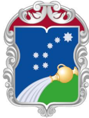
Рисунок нагрудного знака к Благодарности муниципального округа Северный в городе Москве

Приложение 13 к решению Совета депутатов муниципального округа Северный от 18 октября 2022 года № 11/1