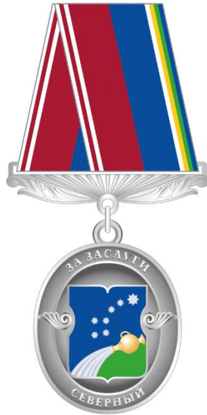
Рисунок знака отличия муниципального округа Северный в городе Москве «За заслуги»

Приложение 7 к решению Совета депутатов муниципального округа Северный от 18 октября 2022 года № 11/1