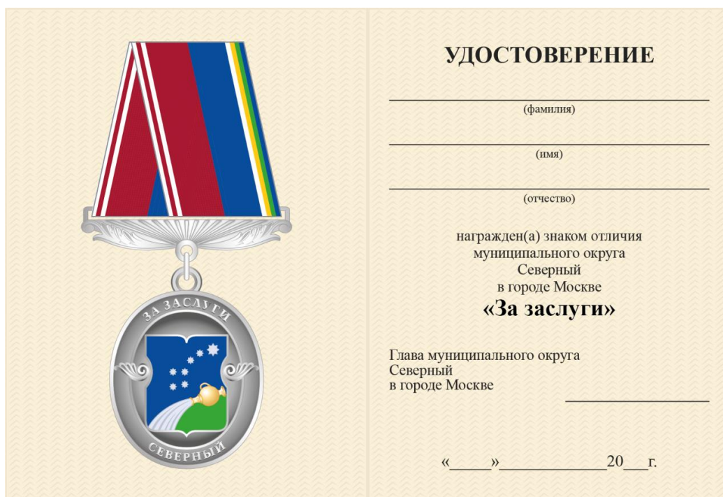
Внутренняя сторона Размер удостоверения 145×105 мм