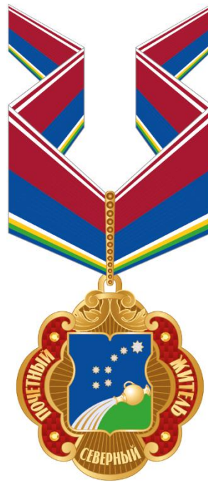
Рисунок знака к Почетному званию муниципального округа Северный в городе Москве «Почетный житель муниципального округа Северный в городе Москве» (на шейной ленте)

Приложение 4 к решению Совета депутатов муниципального округа Северный от 18 октября 2022 года № 11/1