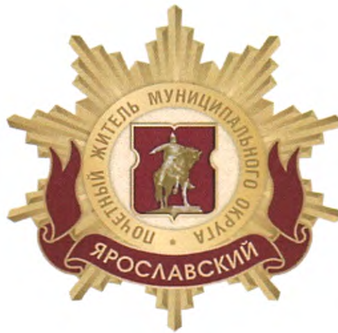
Рисунок нагрудного знака к званию «Почетный житель внутригородского муниципального образования – муниципального округа Ярославский в городе Москве»

Приложение 3 к решению Совета депутатов внутригородского муниципального образования – муниципального округа Ярославский в городе Москве от 20 февраля 2025 года № 35/5