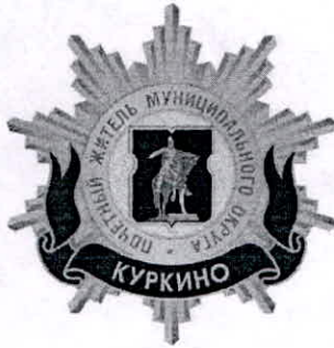
Рисунок нагрудного знака к званию «Почетный житель внутригородского муниципального образования – муниципального округа Куркино в городе Москве»

Приложение 3 к решению Совета депутатов внутригородского муниципального образования – муниципального округа Куркино в городе Москве от « 18 » февраля 2025 года № 3-1