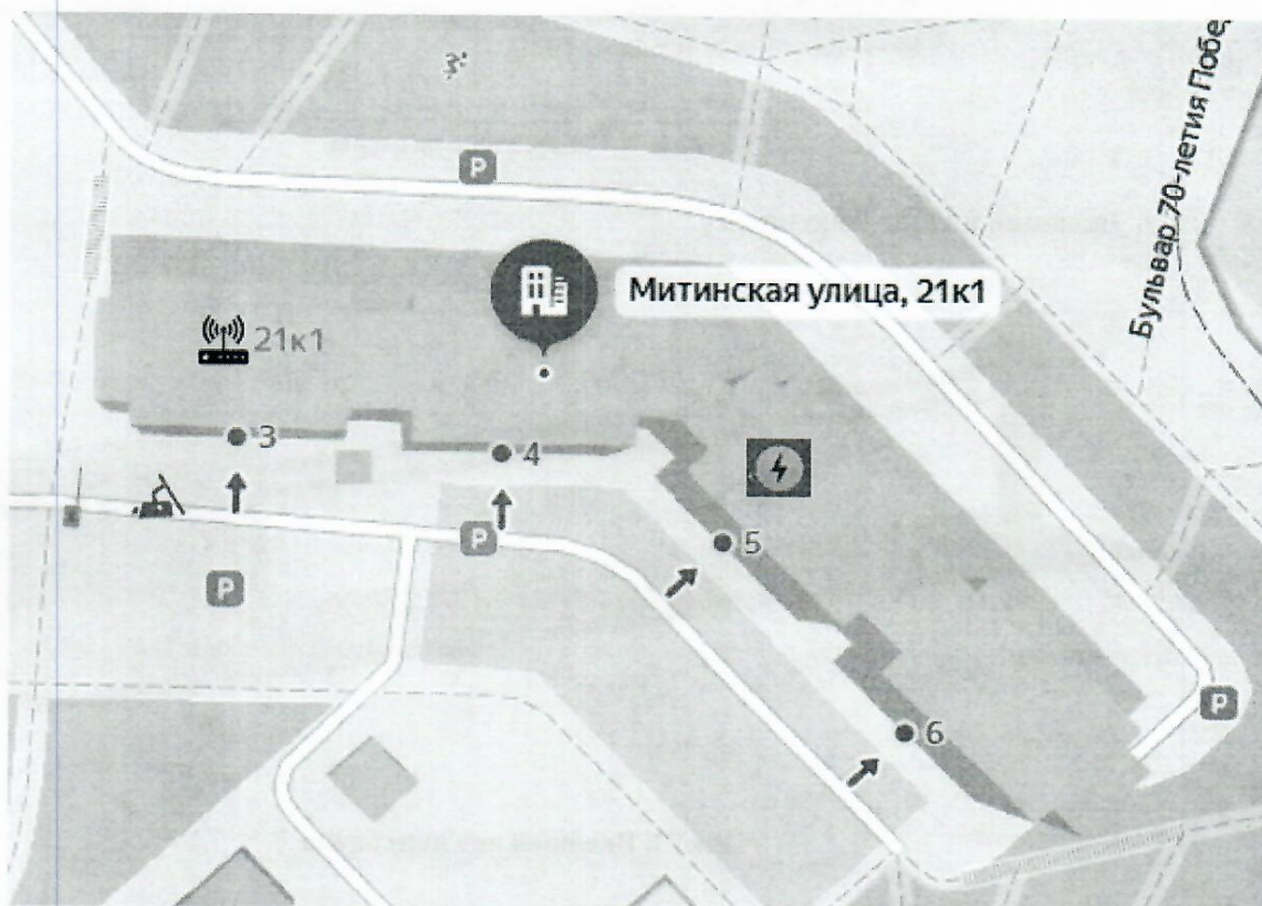
Рис. 1. Схема размещения шлагбаумов