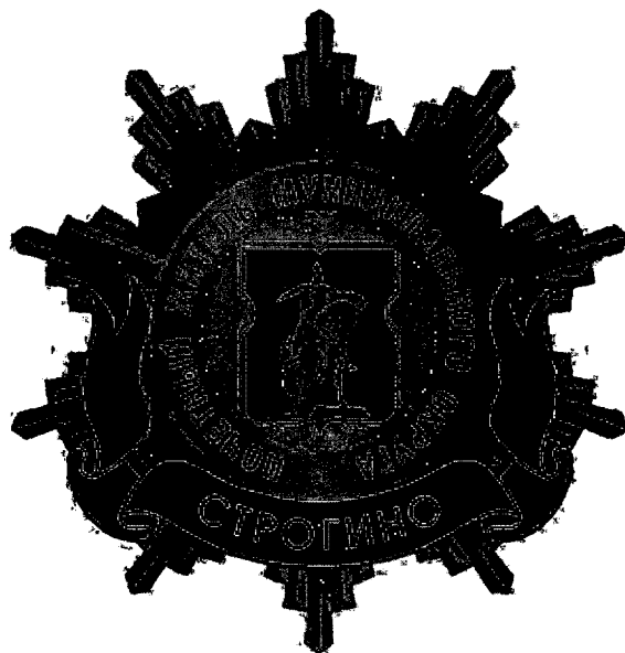
Рисунок нагрудного знака к званию «Почетный житель внутригородского муниципального образования – муниципального округа Строгино в городе Москве»

Приложение 3 к решению Совета депутатов внутригородского муниципального образования – муниципального округа Строгино в городе Москве от 18.02.2025 № 18